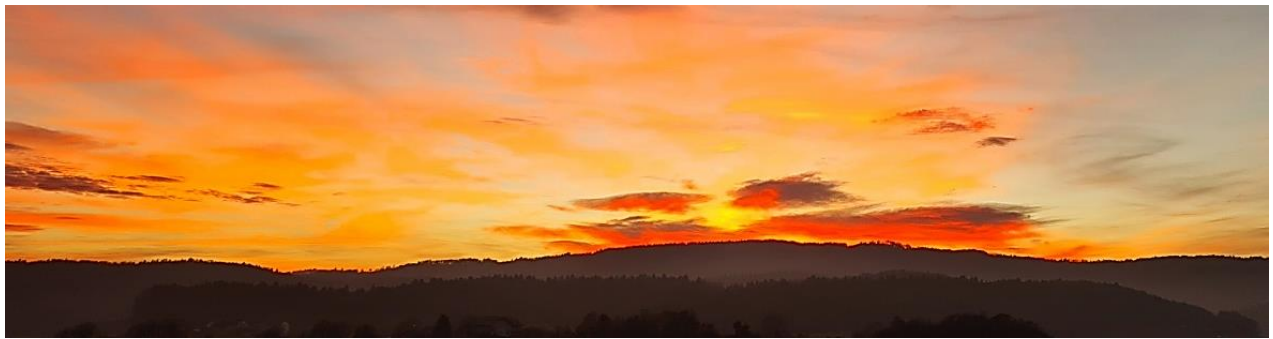
Pogled na sončni zahod iz župnišča v Ivančni Gorici, 19. novembra 2021