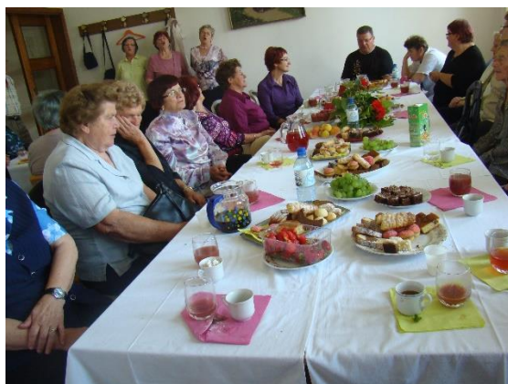
Župnijsko srečanje bolnih in starejših.